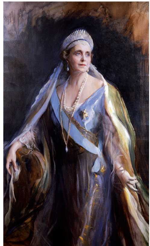
Рис. 1. Портрет Марії кисті Філіпа Алексиса де Ласло (1936 р.)

Завдяки своїй самовідданій праці в госпіталях під час Першої світової війни Марія Румунська стала в Європі одним із символів милосердя. В її здобутку — ціла низка державних нагород, зокрема іноземних (Франція, Великобританія, Італія, Росія, Іспанія, Індія). Вона також була членом Королівського Червоного Хреста Великобританії. Тисячі російських людей, які після революції в Росії опинилися в таборах для інтернованих, були врятовані нею. Талант спілкування з людьми, вміння переконувати,