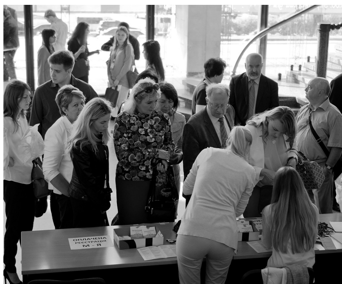
Рис. 1. 26 мая 8:00. Начинается регистрация.