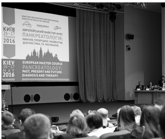
Рис. 2. Открытие мастер-курса.