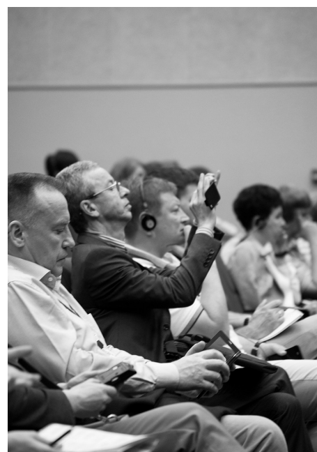
Рис. 8. Врачи «впитывают» знания.