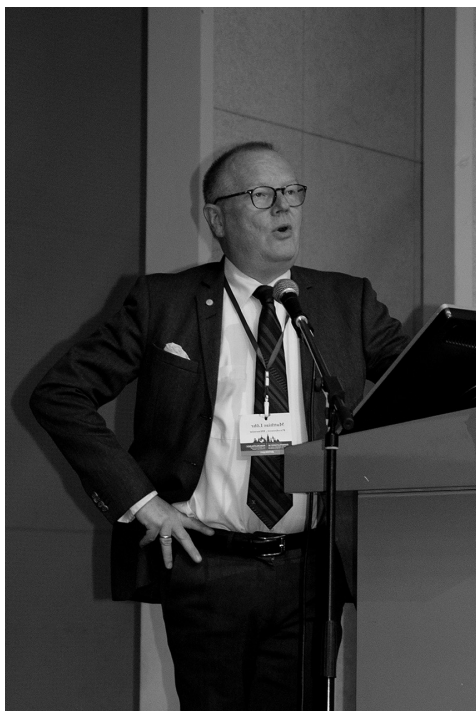
Рис. 4. Выступает проф. М. Lohr (Швеция).