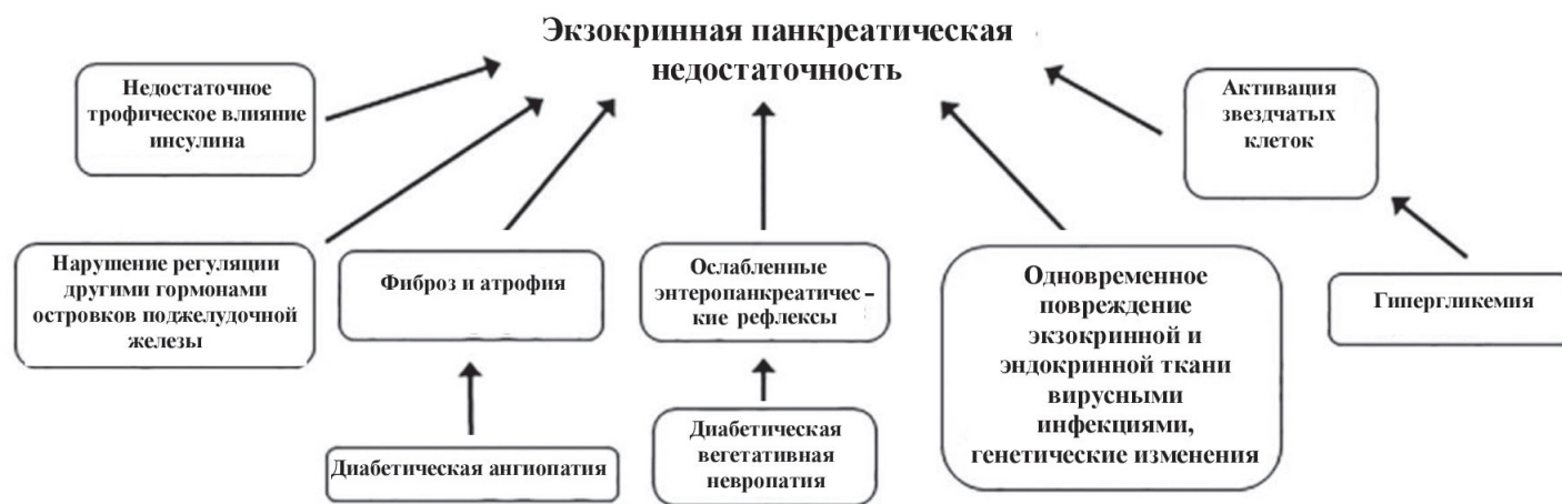
Рис. 2. Механизм возникновения экзокринной панкреатической недостаточности при СД.

влияния на врожденные и приобретенные иммунные реакции [8].